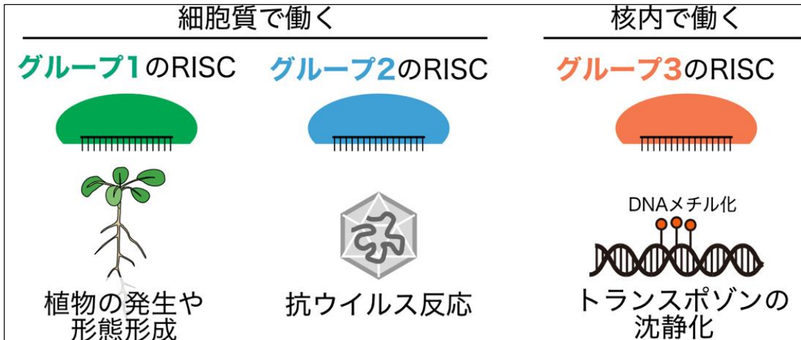
図 1: 各グループに属する RISC の代表的な機能。グループ 1 の RISC (特に AGO1-RISC) は、植物の発生や形態形成などに重要である。グループ 2 の AGO2-RISC は、抗ウイルス反応に関わる。グループ 3 の RISC は、トランスポゾンや非自己遺伝子の沈静化に関わることが知られている。