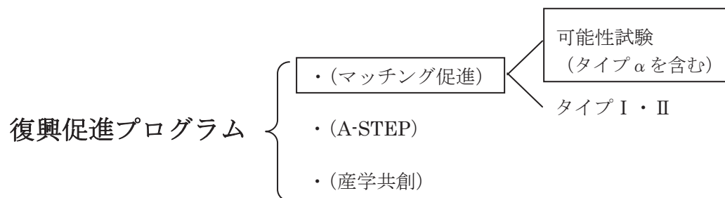
図1 復興促進プログラムの構成

復興促進プログラムは、社団法人東北経済連合会を始めとする産業・経済団体や自治体と連携のもと、マッチングプランナーによる東日本大震災の被災地産学共同研究支援や、全国の大学等の技術シーズの育成強化による被災地企業への移転促進等を総合的に実施することで、全国の大学等の技術シーズを被災地企業において実用化し、被災地経済の復興促進に貢献することを目的としている。復興促進プログラム（マッチング促進）、復興促進プログラム（A-STEP）、復興促進プログラム（産学共創）の3つの事業から成っている（図1）。