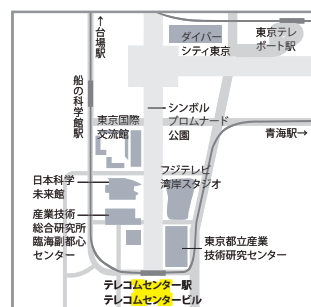
新交通ゆりかもめ「テレコムセンター」駅直結

後援: 内閣府、文部科学省、経済産業省、一般社団法人日本経済団体連合会、一般社団法人東京臨海副都心まちづくり協議会 2017年8月現在