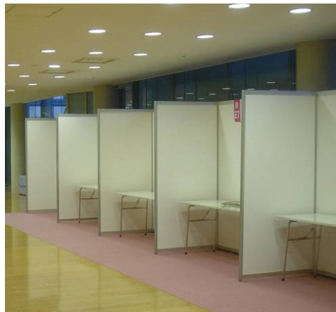
(A-3) テーブルタイプ(3m×4m 程度)