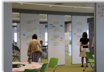
↑ 2019.7.25 共同研究マッチングイベント 「百人百様 × サイエンス」

* 詳細は右記URLをご覧ください。 http://www.sankaku.ynu.ac.jp/