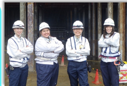
↑ 大成建設の女性技術者