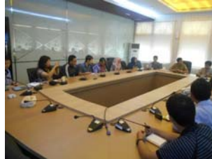
プララワン県政府での聞き取り