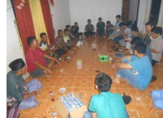
ムルバウ村の村長や住民との意見交換

8月5日にこの調査結果も踏まえて、ステークホルダーを交えた国際ワークショップをリアウ大学で開催した。このワークショップを通じて、ムルバウ村をリアウ大学の支援村とすることで、学際的な支援を行っていくことが決まり、また、リアウ州レベルでのアブラヤシフォーラムを定期的で開催していくことが決まった。