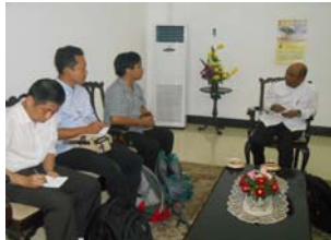
プララワン県知事との面談

ウに行き、プララワン県知事と面談して調査に関して承諾をもらい、リアウ大学教員、学生、インドネシア科学院スタッフ、本FSのメンバーでムルバウ村で学際的合同調査を実施した。