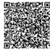
詳しくは動画で解説しています