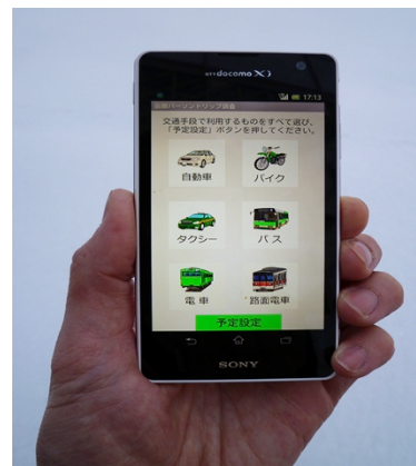
図2 スマートフォンアプリ画面

スマートフォンを用いてパーソントリップ調査のための交通行動調査ツールを開発し(図2)，函館地域の市民20名を被験者に対して，2012年12月から個人の交通行動調査を行った．交通行動の目的，目的地，交通機関，およびGPSデータなどを収集している．既存のパーソントリップ調査と異なる点として，長期にわたる交通行動調査，予定と実際の行動，および予定変更の理由を入力さ