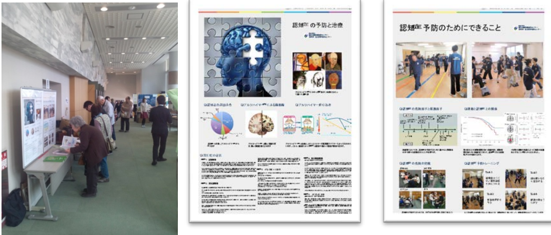
図9. パネル展示の様子