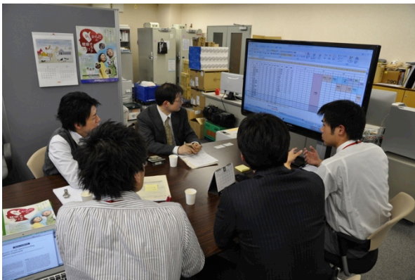
図10. 打ち合わせの様子