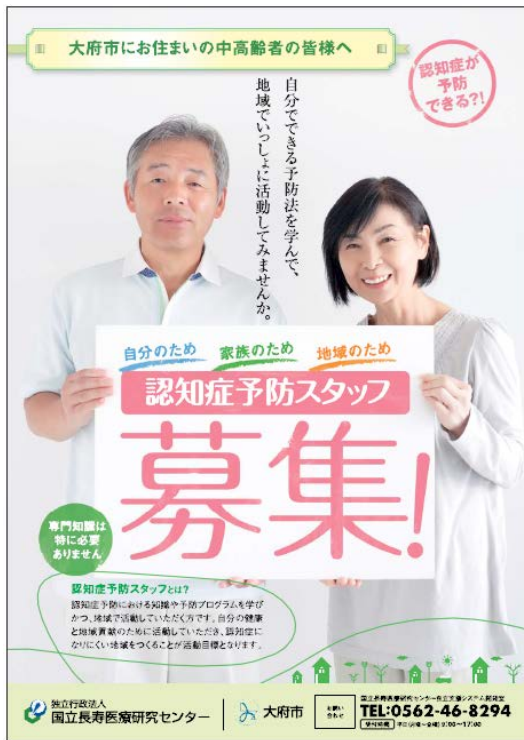
図 1 1. 認知症予防スタッフ募集リーフレット