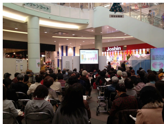
図8. 公開講座の様子