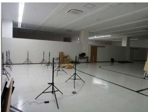
図3. 健康増進・老年病予防センター

スクリーニング検査は、合計5,000名の参加を見込んでおり、効率よく参加者数を確保するため1日80~100名の参加者を収容できる会場の確保が必要となる。大府市は国立長寿医療研究センター健康増進・老年病予防センター（図3）を会場とする。名古屋市緑区は、行政の協力を得て講堂（図4）や体育室（図5）などをご紹介いただき、十分な広さの会場を確保できた。検査日程は、各会場の規模と確保状況から合計71日間の日程を設定した。