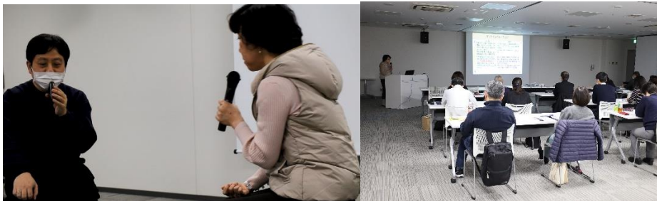
第一回包括的性虐待対応プログラム

2024年1月20.21日に第一回包括的性虐待対応プログラム研修として群馬県前橋市で実施した。医療者、警察、検察、児童相談所職員など約20名が参加した。