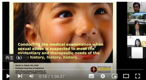
ZOOMでのマーティン フィンケル講義