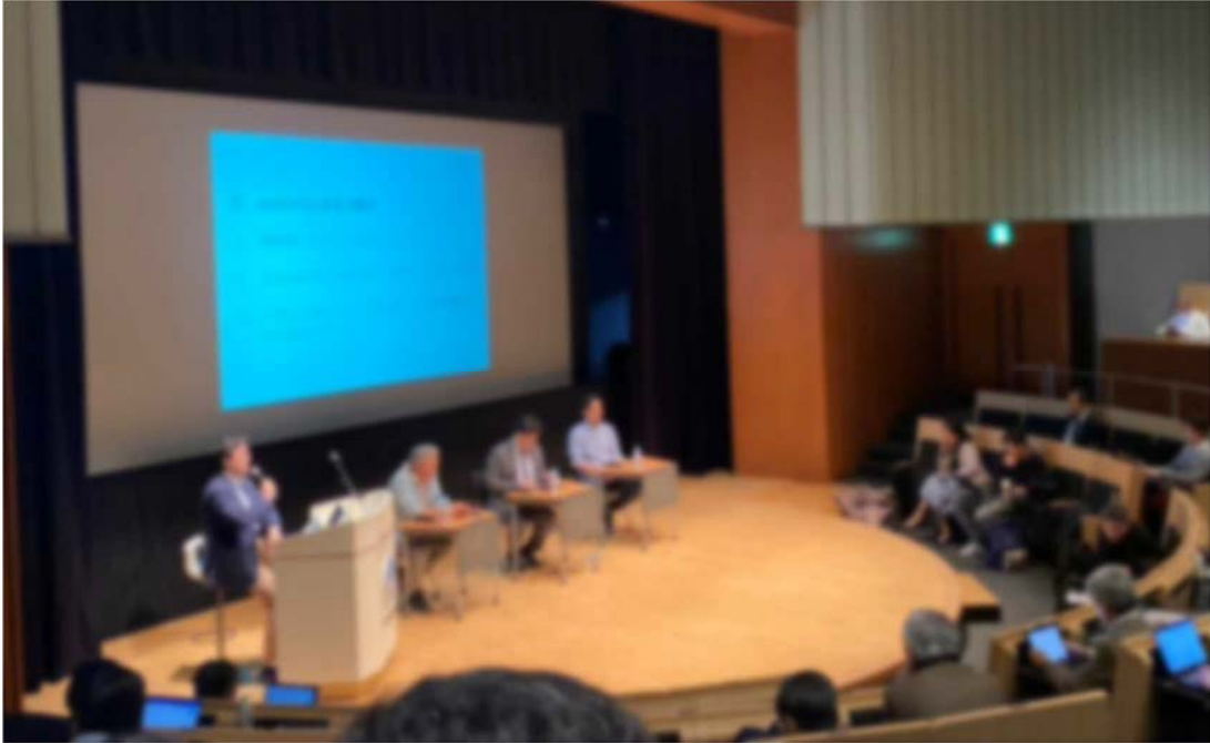
写真 3 2020年2月5日開催シンポジウム パネルディスカッションの様子