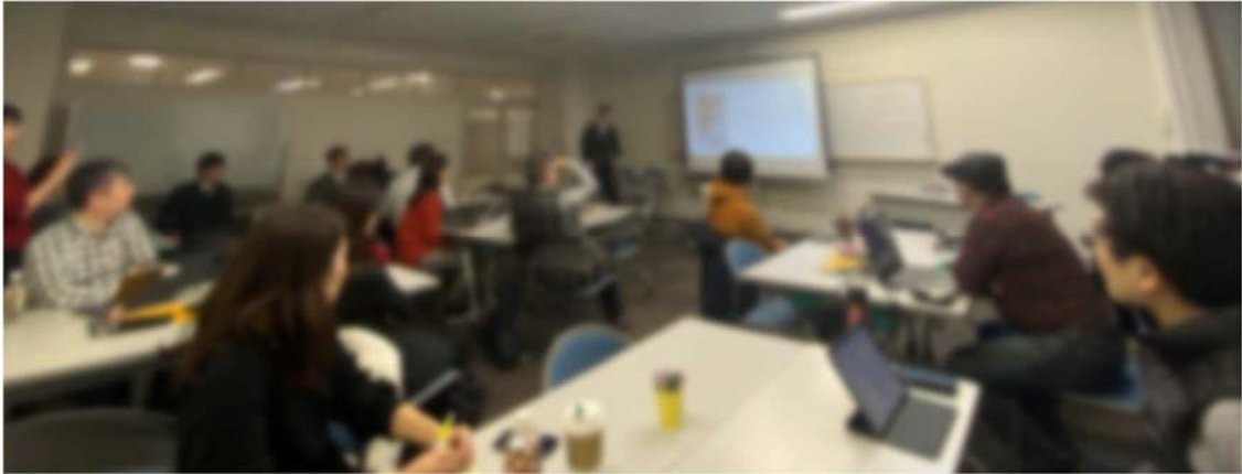
写真 1 パーソナルWS@KANAZAWAの様子