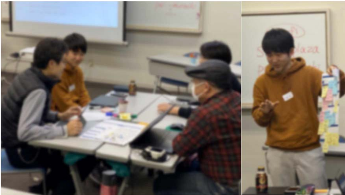
写真 2 パーソナルデータWS@KANAZAWAの様子