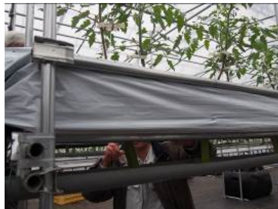
(写真3) 温室トマト栽培の視察の様子