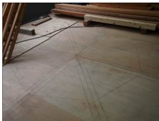
(写真2) 水車用木材・水車設計中木材