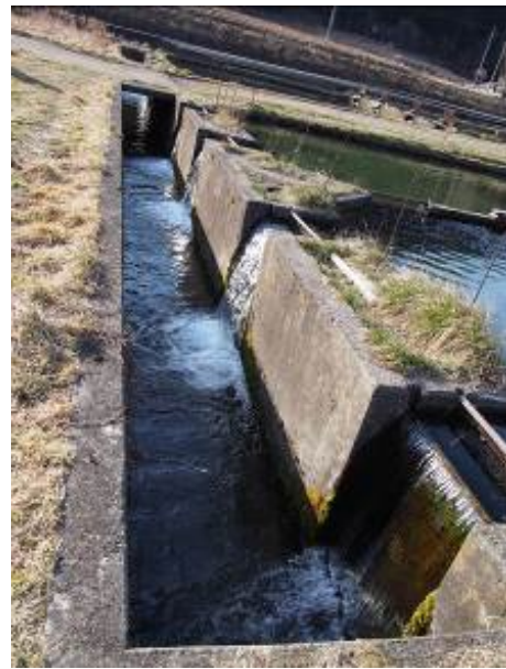
(写真1) 水路調査の様子 (設置決定場所：養魚場排水路)