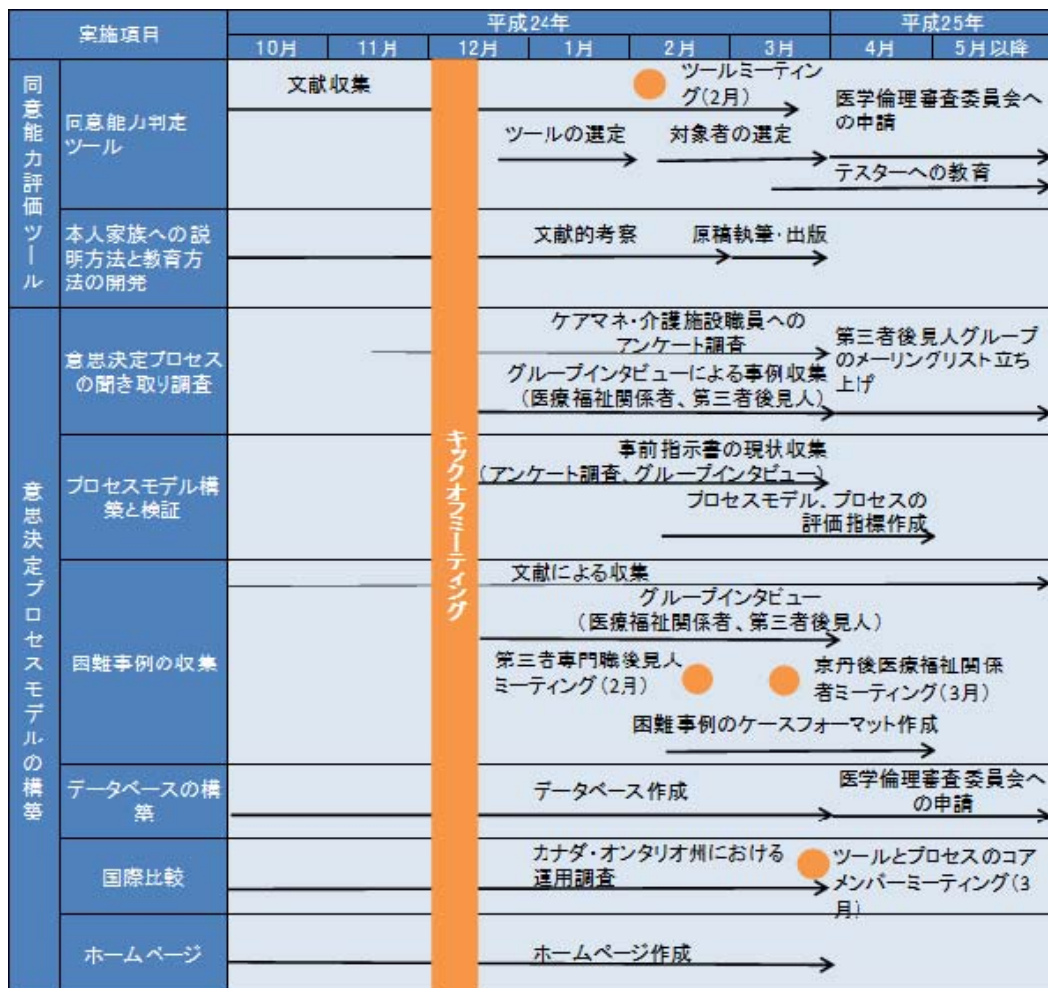
図2 平成24年度のプロジェクト全体の進捗状況の概要

平成24年度にメンバーで行った議論の結果、多くの事例に適用可能な一般的プロセスモデル以外に、困難事例への対応に関してまとめた事例集作成が必要であることで意見が一致した。そこで、文献、及び参加メンバーから意思決定プロセスに困難を生じた事例を収集していく予定である。平成24年度は、第三者専門職後見人及び医療福祉関係者がそれぞれ経験する困難事例を集めて症例の特徴を抽出するためのケースフォーマットを作成した。