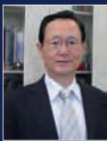
文部科学省 革新的エネルギー 研究開発拠点形成事業 研究総括