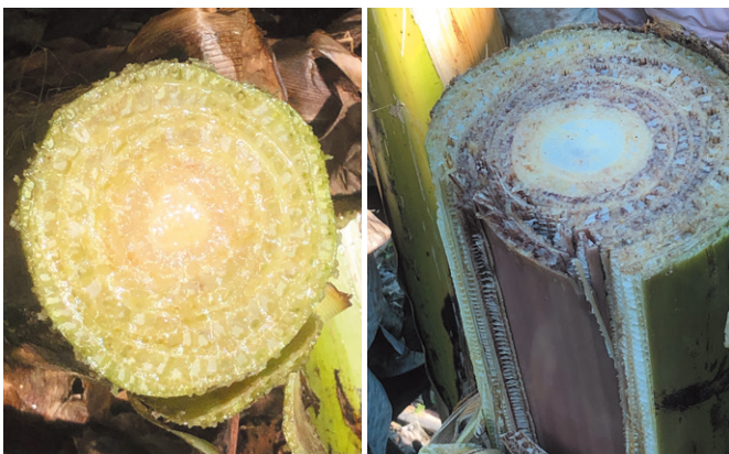
図1 健康なバナナ(左)の茎はきれいでみずみずしいが、萎凋病に感染すると(右)維管束が褐変して茎が割れる。