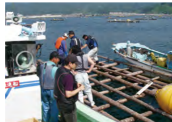
岩手県山田町での設置の様子