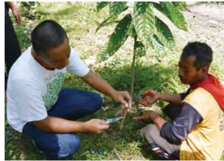
ボレワリ(インドネシア)では、地域の農家、NGO、地域や国際市場の関係者と協働した技術開発と先進的な農場管理によるカカオ農家の福利向上に取り組む。

アジア・アフリカなどの各地域における、貧困層に属する社会的弱者と多様な分野の研究者の協働による総合研究を通じて、貧困層が直面する課題と、彼、彼女らが生業の中で創り出している革新的な知恵や工夫を抽出して、貧困解消に役立つ知識や技術の協働生産と実装を推進する。