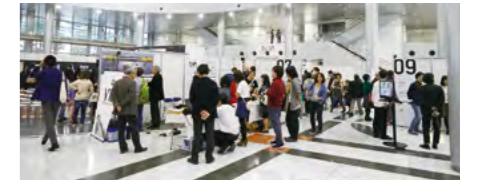
サイエンスアゴラ2018の展示ブース 科学技術コミュニケーション推進事業 (※4月から未来共創推進事業に変更予定) ● https://www.jst.go.jp/sis/

イノベーションの創出や現代の複雑化する経済・社会的課題への対応には、多様な価値観を持つさまざまな人々の視点が欠かせない。科学と社会のこれからを共に考え、未来を共に創っていく「共創」を推進することが重要だ。「共創」を推進する取り組みの1つとして、あらゆる立場の人たちが参加し、科学と社会のこれからについて対話する日本最大級のオープンフォーラム「サイエンスアゴラ」を毎年実施している。