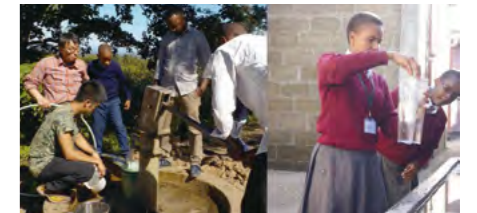
タンザニアにて、地下水の水質調査(左)や、現地の学生による浄水実験を実施した(右)。

フッ素をはじめとする危険物質を、高機能な無機結晶材料などで吸着除去し、水環境問題の解決を目指す。