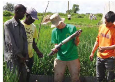
ムエア(ケニア)のイネ研究圃での土壌サンプリングの様子 地球規模課題対応国際科学技術協力プログラム(SATREPS)

近年ケニアではコメの消費量が急増しているが、干ばつや冷害などによりコメの増産が阻害されている。そこで、DNAマーカー選抜などの日本の先端技術を用いて、ストレスに強い遺伝子をテラーメードで導入し、現地の環境に合った多数の有望系統を育成し、施肥体系や水管理技術の改善を進めた。構築した研究基盤を活用することで、サブサハラ地域のイネ研究・育種拠点としての発展を図る。