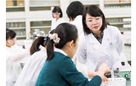
実験体験講習会では、現役学生であるRSS(Rikkyo Science Supporter)が丁寧に実験補助、指導を行う。

「女子中高生の理系進路選択支援プログラム」の実施機関である立教大学では、理学部・理学研究科を卒業・修了して、研究だけでなく航空、ITなど多様な業界で活躍する女性の講演と交流を通じて、理系進路を選択した際の将来の可能性の幅広さを知る機会を提供している。また、知的好奇心を引き出す最先端の理学研究に触れる機会として、実験体験講習会やチャレンジ・ラボを開催している。