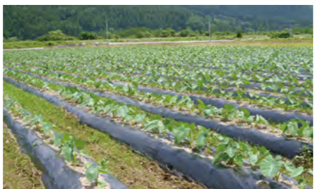
保湿・防草効果で作物の生育をサポートする農業用マルチフィルム

プラスチックは使いやすくメリットが多い素材だが、廃棄物として長期間残存するため、深刻な環境汚染が社会問題となっている。利便性をそのままに環境における安全性を確保するため、研究者と開発企業は、植物由来原料から微生物発酵技術により生分解性プラスチックを開発した。石油を原料としないので地球温暖化対策にも貢献し、グローバルな展開が期待される。