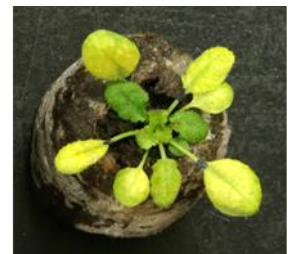
図1. P. syringae に感染したシロイヌナズナが示す黄化症状

植物病原細菌の一種で、様々な作物に感染し病気を引き起こします。その被害額は年間 10 億ドルを超えるとの試算もあります。シロイヌナズナにも感染するため(図1)、植物の抵抗性や細菌の病原性を研究する材料として世界中で広く用いられています。