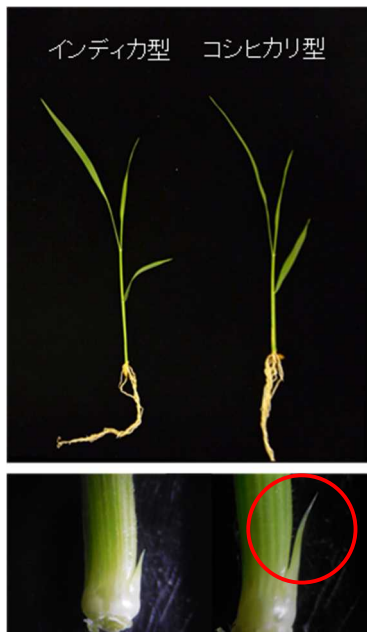
図 1. インディカ型とコシヒカリ型 MP3 の腋芽伸長の様子

コシヒカリ型 MP3 を持つ品種は、幼苗の段階で腋芽の伸長がインディカ型 MP3 よりも旺盛であることが分かります (図中○印)。