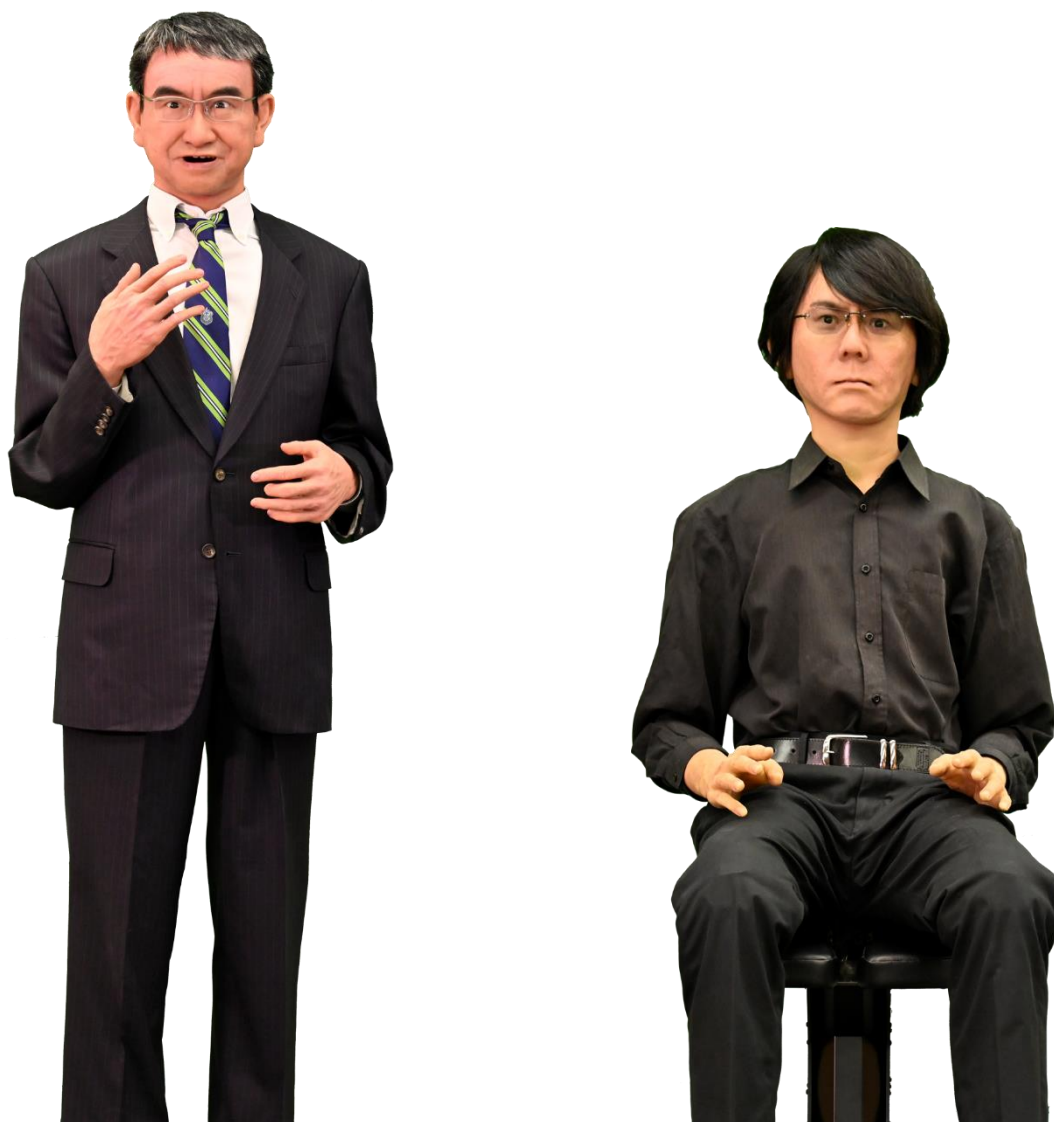
図1 左：ジェミノイドTK（河野 太郎 大臣のアバター） 右：ジェミノイドHI-6（石黒 浩 教授のアバター）