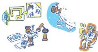
身代わりロボットでどこへでも行ける

「身代わりとしてのロボットや映像などを示すアバターに加えて、人の身体的能力、認知能力および知覚能力を拡張するICT技術やロボット技術を含む概念」で、Society 5.0時代のサイバー・フィジカル空間で自由自在に活躍するものを目指しています。CAは下図 (JST資料 ムーンショット目標1「2050年の社会」より) のように、身体、脳、空間、時間の制約から解放するためにさまざまな機能や形態が考えられています。