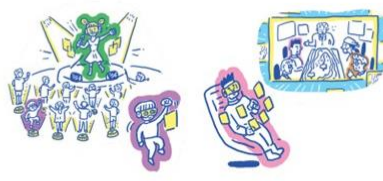
サイバー・フィジカル空間の映像アバターでリアルな体験