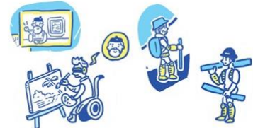
身体・認知・知覚能力を拡張して充実した人生を