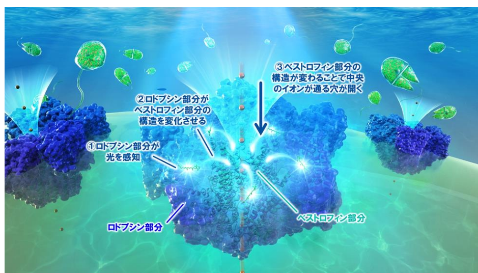
図 4 ベストロドプシンがイオンを透過する分子メカニズム。

以上の結果から、レチナールが折れ曲がる反応の後、ロドプシン部分全体の構造が変わり、それがベストロフィン部分へ伝わることで、複合体中央のチャンネルが開くことが分かり、ベストロドプシンが光でイオンの透過を制御する分子メカニズムが明らかになりました（図 4）。