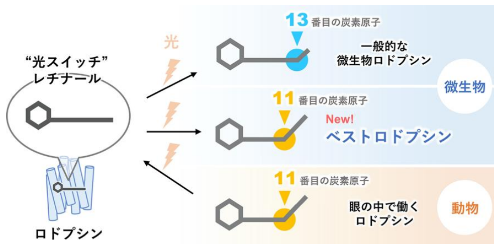
図 3 光によるレチナールの構造変化の比較。ベストロドプシンは微生物が持つロドプシンの仲間でありながら、動物のロドプシンと同じ箇所（11番目の炭素原子）でレチナールが折れ曲がる。

また、すべてのロドプシンは氷点下 200 度に冷やしても、光でレチナールが曲がることが知られていましたが、ベストロドプシンは氷点下 100 度以上にしないと光で反応しないという不思議な性質を持つことが分かりました。赤外分光解析の結果からは、タンパク質内部のアミノ酸残基に由来するプロトン化したカルボン酸の水素結合変化や主鎖の骨格構造の変化が明らかになりました。