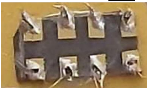
図1. 酸化亜鉛試料の写真

酸化亜鉛試料の電気測定にはチタン電極を蒸着し、電極に対してインジウムを用いた半田で配線を行います。