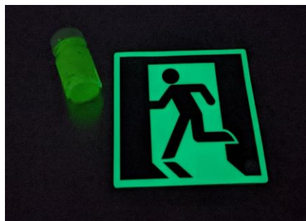
(図1) 一般的な蓄光材料

本研究成果は、2021年11月29日(月)(ロンドン時間)に科学雑誌「Nature Materials」にて公開される予定です。