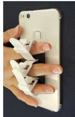
図2ホルダーによる固定