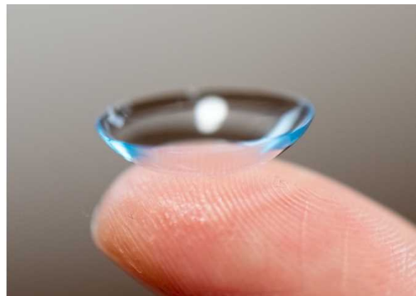
図1：今回、本研究グループは、ゼリー（左図）・ソフトコンタクトレンズ（右図）などのやわらかくウェットな「ゲル」のやわらかさを決める物理法則を明らかにした。ゲルのやわらかさには、「負のエネルギー弾性」というこれまで知られていなかった要素が潜んでいた。