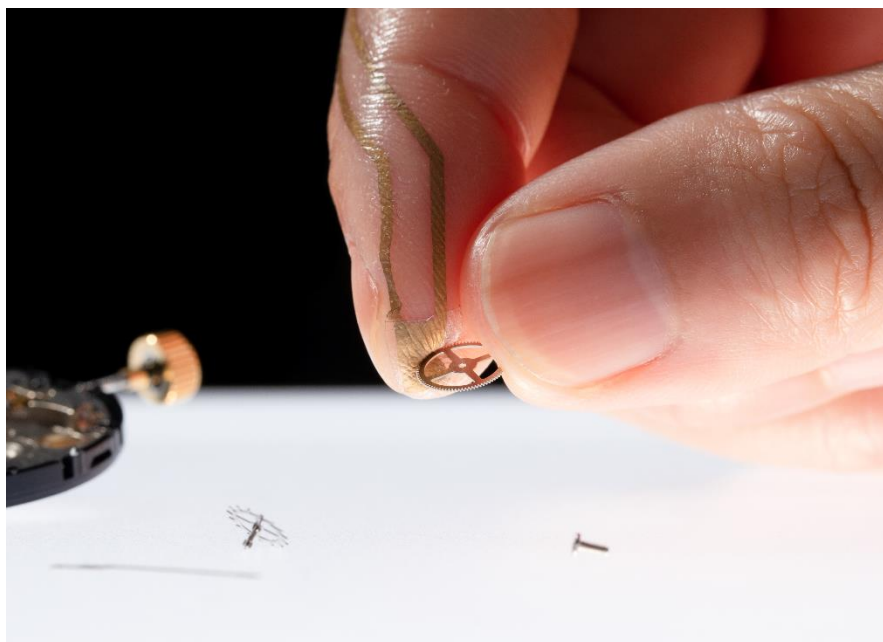
図1 指の先に貼り付けたナノメッシュ圧力センサー。