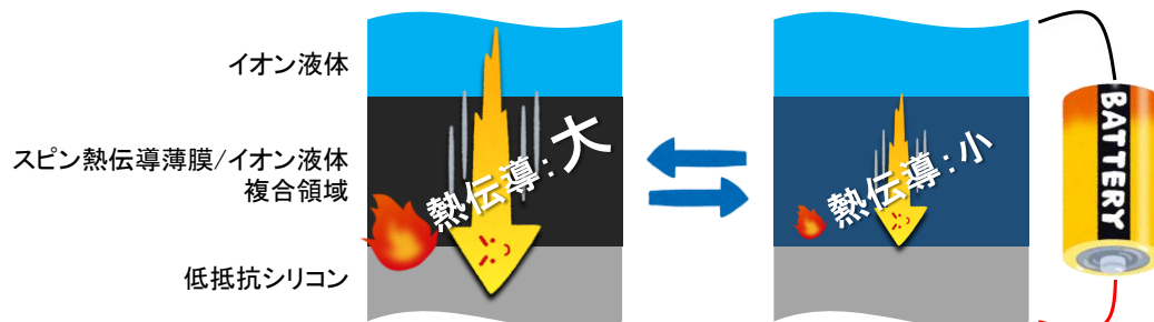
図1. スピン熱伝導の電氣的制御(模式図)。試料に電圧を加えることによってスピン熱伝導物質の熱キャリアであるマグノンの移動が阻害され、複合領域の熱伝導を抑制することができる。

本研究成果は、英国オンライン科学誌「Scientific Reports」に令和2年9月2日に掲載されます。