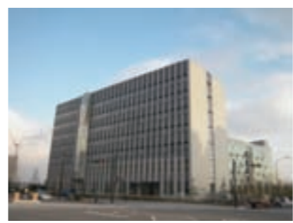
高度計算科学研究支援センター