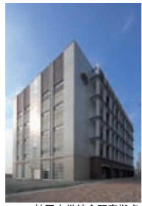
神戸大学統合研究拠点