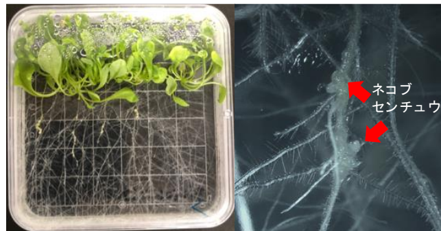
図1. シロイヌナズナを用いたネコブセンチュウ感染系

サツマイモネコブセンチュウは多種多様な農作物に被害をもたらす重要害虫であり、基本的に雌単独の単為生殖により増殖する。環境条件によっては雄が出現する可能性があることが知られているが、その仕組みは明らかになっていない。本研究課題では、宿主であるトマトに対して様々なストレスを付与し、雄線虫出現への影響を調べ