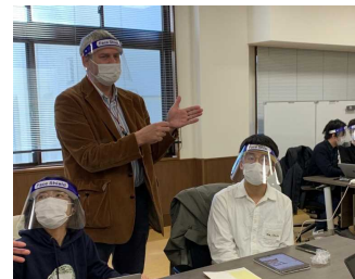
リーダーシップのトレーニング フェローシップオリエンテーション