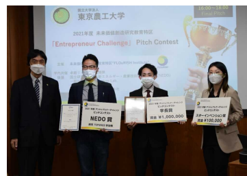
アントレプレナーチャレンジ2021