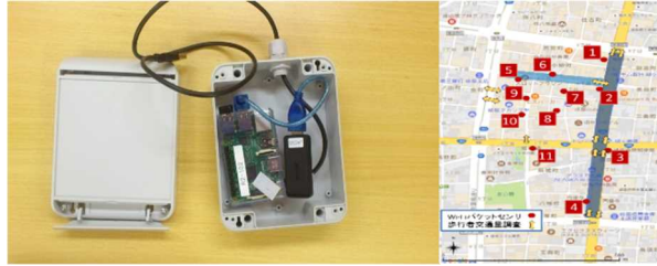
図 Wifi パケットセンサー

近年、問題がより深刻化している途上国大都市における都市、交通問題の解決は喫緊の課題である。この課題に対しては、土地利用構造や地域の社会構造を反映させるため、都市空間における「場のつながり＝コンテキスト」を重視することがその解決策であると考えている。この場のつながりを表現するため、人々の移動を把握する必要があるが、既存の技術では限界が有り、ICT 技術を利用した移動実態の把握方法、分析方法、計画への反映方法について、検討を行った。