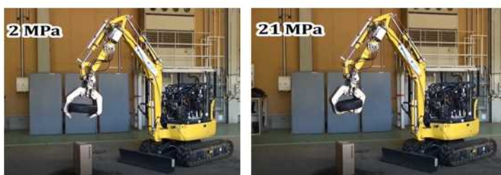
遠隔センササーボによる力制御