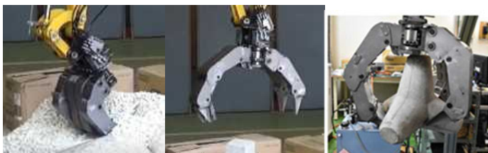
バケットモード(左)ハンドモード(中, 右)

開発したコンポーネントを用いて、多指ハンド2号機を開発した。大阪大学吉灘教授と小松製作所と協力して、建設ロボットに搭載し、バケットモードとハンドモードの切り替え、形状倣い把持、ならびに遠隔センササーボによる力制御に成功した。