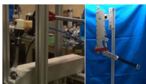
人工筋ロボによるはつり動作(左), 跳躍/着地ロボット(右)