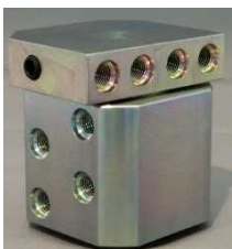
4チャンネル小型スィベルジョイントの例

共栄産業株式会社と新たに秘密保持契約を結び, 多自由度スィベルジョイントと細径柔軟ホースを開発した。これらは下記の建設ロボット用ハンドと脚ロボットで用いられている。