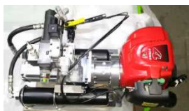
エンジン駆動油圧パワーパック

KYB株式会社と協力して, エンジン駆動油圧パワーパックと, 新たに開発した高性能モータを用いたパワーパックを開発した。脚ロボ本体への搭載を想定した設計で, 全姿勢対応および可変吐出が特徴である。