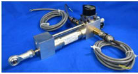
開発した小型軽量低摺動シリンダの一例

JPN株式会社と協力して内径φ10~30mm, 35MPa動作, 最小動作差圧0.1Mpaのシリンダを開発した。従来の油圧シリンダに比べ, 約2~5倍の「力/自重比」, 約1/3~1/5倍の低摩擦動作が可能である。低摺動パッキンの採用, 軽量化構造設計, チタン合金/マグネシウム合金の使用がこれらを可能にした。