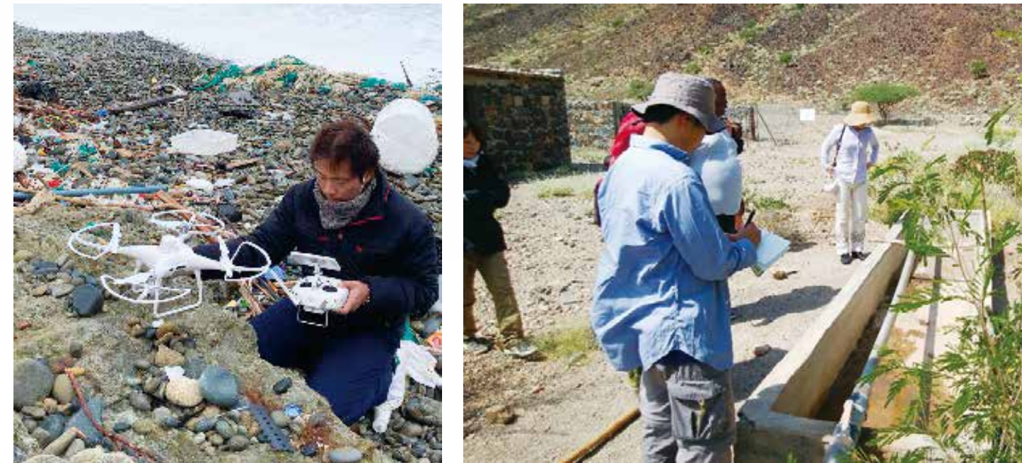
写真左：海岸部に漂着したプラスチックゴミをドローン空撮によって検出している様子（タイ） 写真右：極乾燥地の農場を訪問し、地下水の利用状況を調査している様子（ジブチ）

生態系・生物多様性の劣化、都市への人口集中、生産・消費活動の増大、環境汚染の拡大、気候変動など、地球規模で直面している環境課題の解決を目指します。