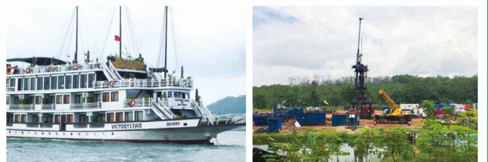
写真左：バイオディーゼル燃料で走るハロン湾の観光船（ベトナム） 写真右：CSS(Carbon dioxide Capture and Storage)パイロット事業に向けた工事の様子（インドネシア）

温室効果ガスによる気候変動を緩和するカーボンニュートラルの実現を目指して、エネルギー消費の抑制、再生可能エネルギーの促進、スマートソサイエティなどの研究開発を行います。