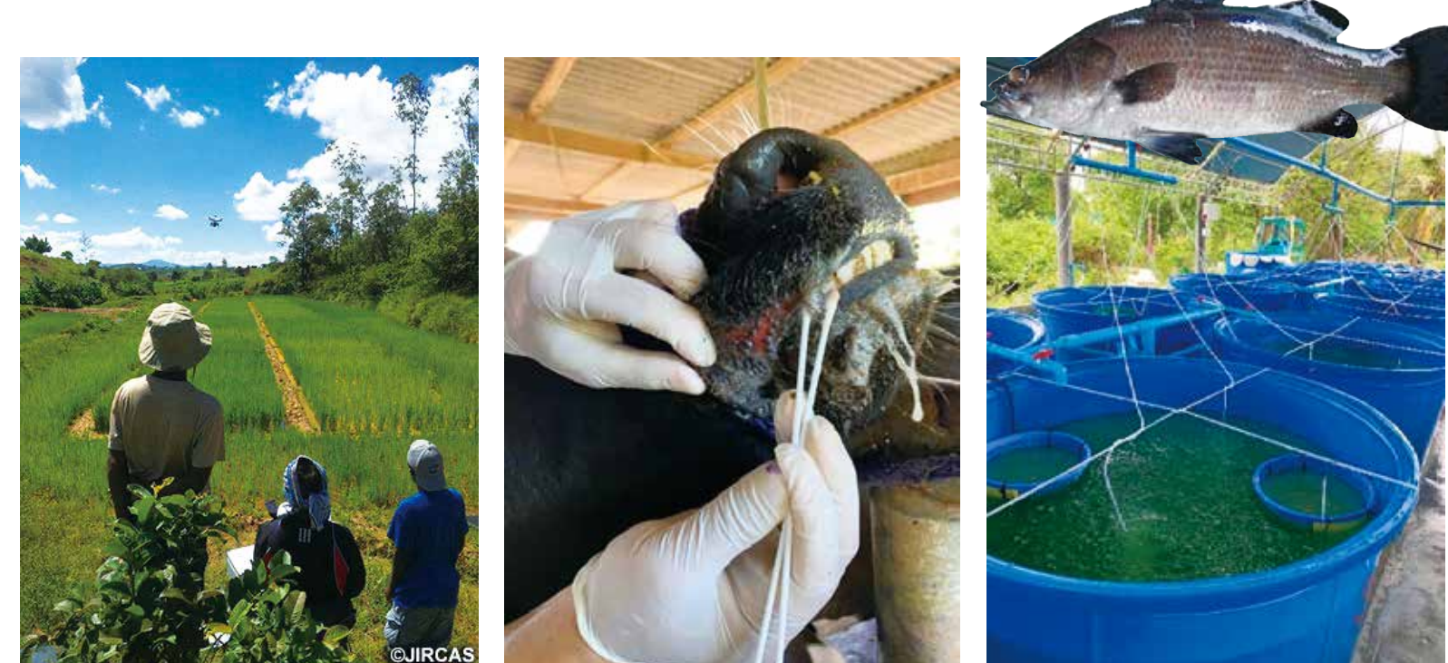
写真左：ドローンによる水田での生育調査（マダガスカル） 写真中：家畜感染症のマルチ診断システムの開発（タイ） 写真右：食糧安全保障を目指した養殖法の開発（ゲノム育種、ワクチン等）（タイ）

気候変動は世界規模で様々な変化をもたらしており、生物資源の多様性および持続的な生産が脅かされています。食料、飼料、さらにエネルギー源など生物資源がもたらす恩恵を将来にわたって享受し続けるため、持続可能な生産・利用方策を提示します。