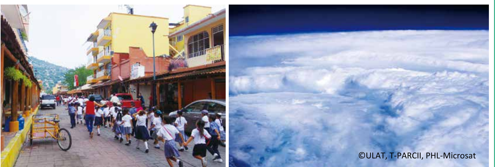
写真左：津波避難訓練に取り組み子供たち（メキシコ） 写真右：フィリピン海で発生した台風の目を航空機から観測（フィリピン）

安全かつ強靱（レジリエント）で持続可能な都市・社会の実現を目指して、自然災害や都市化に伴う大規模災害の防災・減災に関する研究を、日本の経験・知見を生かしながら、全地球的な枠組みの中で総合的・組織的に展開します。