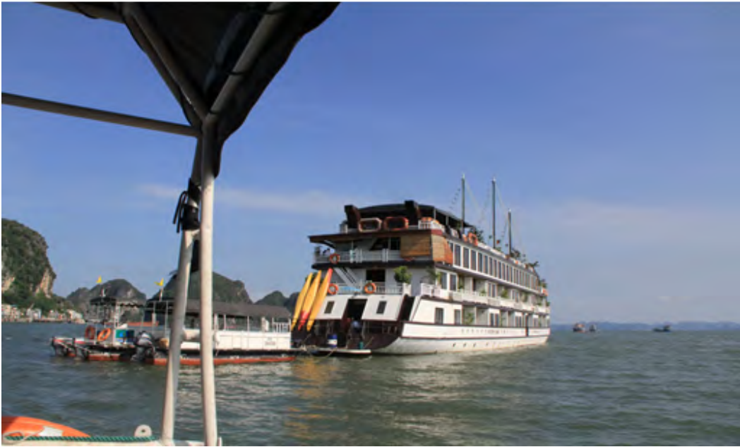
写真1 B100で運転しているハロン湾観光船