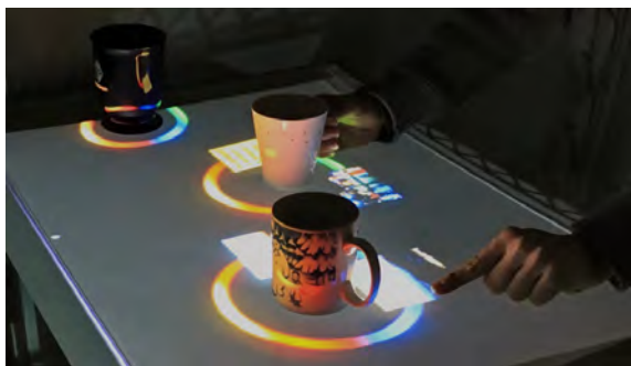
図 1. SnapRail インタフェース

概要. 日常生活においてはコーヒーカップ等をテーブルの上におく．このことはテーブルトップデバイスを日常生活で利用する際にも起こり、その時テーブルトップコンピュータの画面がその画面上の物体によって隠される．この問題を解決するために我々は SnapRail というユーザインタフェースウィジェットを提案する．画面上に物が置かれるとそれを認識し、画面に表示される要素が隠されることのないように移動する．これによって視認性の向上が期待される．移動する先は画面上の物体の周りに現れるレールウィジェットに吸着するように移動する．これによって、ユーザはウィジェットを用いて吸着した要素をタッチ操作で自由に操ることができ、操作性の向上が期待される．