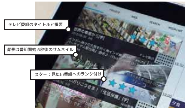
図 3. 番組コンテンツ情報

メディアブラウザより, 見たいコンテンツがある場合ドラッグ&ドロップによって, タイムラインの特定の時刻に配置できる。この際, 2つの制約がある。まずGoogleカレンダーの予定が優先されるため, その部分に配置できない。次に配置するコンテンツの時間の幅が, 予定と予定の間やコンテンツがすでに配置された間の場合, 配置するコンテンツがその合間時間以内でなければ配置できない。また, ある程度ジャンルは絞りたいが, ここの隙間は何でもいからコンテンツを埋めたいという場合にDrag&Fill機能を実装した。Drag&Fillは, TVのジャンルアイコンをタイムラインにドラッグすると, そのすき間の時間にできるだけ近いそのジャンルのコンテンツを自動選択し配置し, ユーザが時間ぴったりのコンテンツを探す手間を省く。これはたとえば, 夕食から風呂の間に, スポーツ関係の情報を知りたいが, 特別の番組にはこだわらない場合に利用する。これは検索履歴の項目に対しても有効である。そのため何らかのオリンピック情報をこのすき間に埋めるといったことができる。Privateの項目の写真アルバムも, Drag&Fillが働き, その前後の予定あるいはコンテンツの間が埋めるように配置される。写真の場合はスライドショーとなり, 2秒おきに写真が切り替わり, アルバムの写真を埋められた時間内BGMと共にループ再生する。Web項目のYouTubeもDrag&Fillが働く。なおタイムラインからの削除はメディアブラウザにコンテンツを移動するだけで