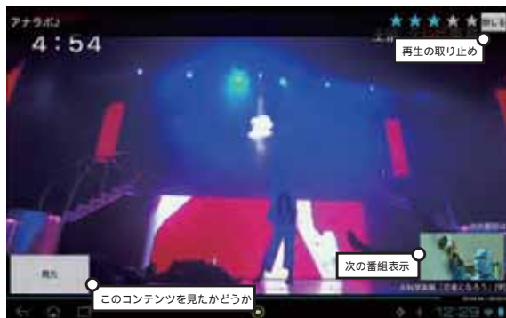
図 4. 90 %再生時に「見た」ボタン表示と次の番組案内が表示される

コンテンツが提示されて見始めたはいいが、面白くなく見るのをやめたい場合は閉じるボタンを押すことで、視聴をやめることができる。その際、同時にタイムラインとウィッシュリストからそのコンテンツが取り除かれる。