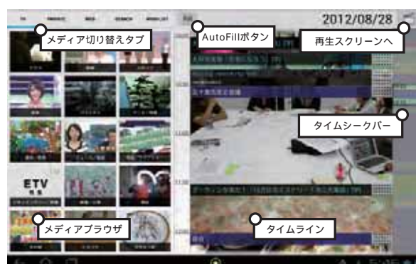
図 2. TimeFiller のスクリーンショット

一方で、一定の再生時間を持つコンテンツを圧縮し、鑑賞時間の削減を実現する技術も無理のない健全なコンテンツ消費のためには有意義であり、研究が盛んである。これはコンテンツの要約技術 [4][6] もしくは高速再生技術 [2][5] に細分される。要約技術はスポーツやニュース、監視カメラ映像などの「結果を素早く理解する」ことに価値を認められるコンテ