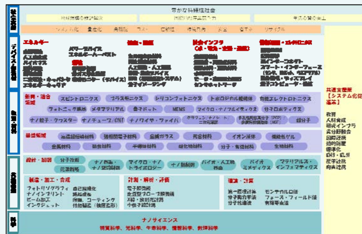
社会・産業と技術の変遷とナノテクノロジーの進化