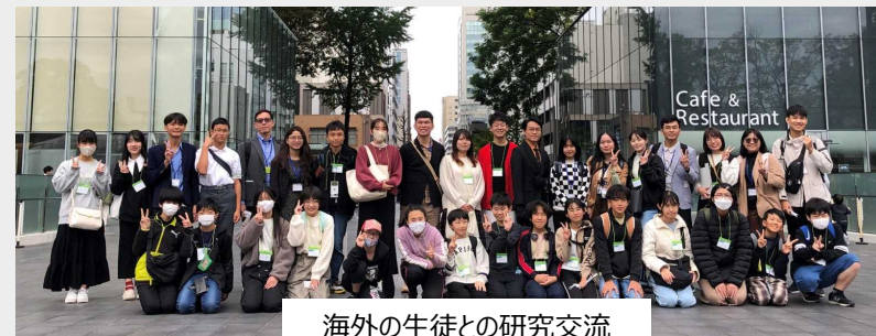
海外の生徒との研究交流