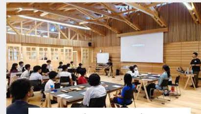
アントレプレナーシップセミナー