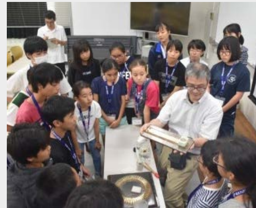
▲極低温で起きる物理現象