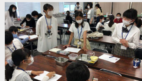
▲対面によるエリア独自の講座（観察実験講座）