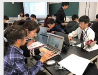
プレゼンテーション講座