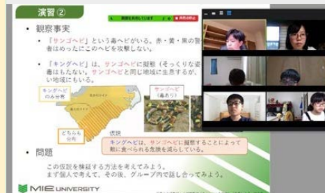
▲オンラインによるエリア共通講座（探究活動講座）