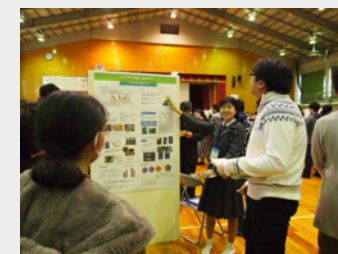
SSH校での研究成果発表