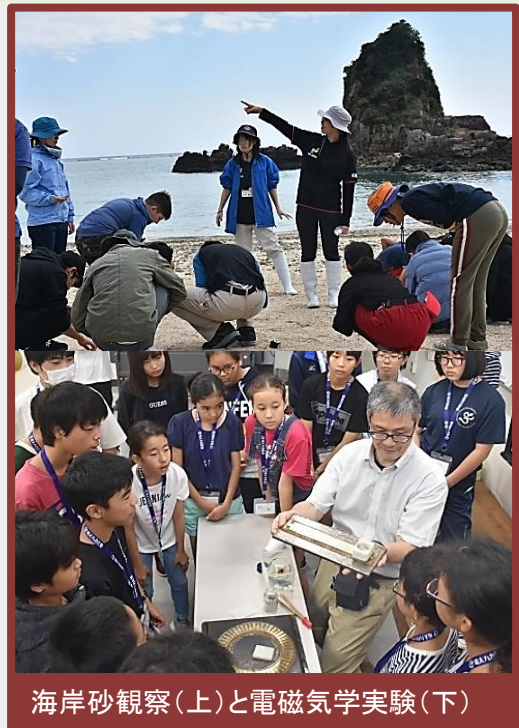
海岸砂観察(上)と電磁気学実験(下)