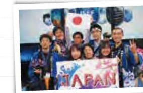
頑張ろう、チームジャパン! (ISEF)