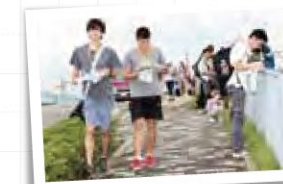
授業では珍しい地理のフィールドワーク (地理オリンピック)