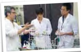
冬期特別セミナーで 実験演習に挑戦 (生物学オリンピック)