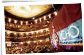
晴れがましい表彰式の舞台 (化学オリンピック)