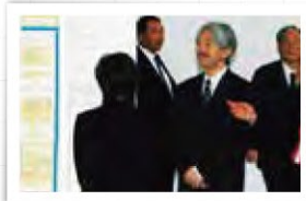
秋篠宮皇嗣殿下のご内覧のようす (日本学生科学賞)