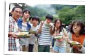
夏季セミナーではバーベキューを楽しむひと時も (数学オリンピック)