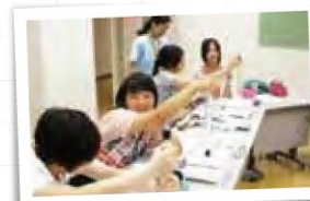
フレチャレンジは、物理チャレンジへの第一の扉です (物理オリンピック)