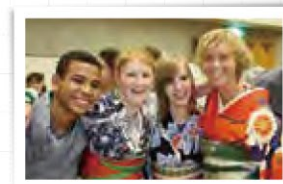
日本開催の国際大会での一幕 (化学オリンピック)