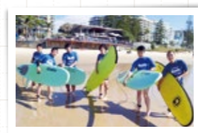
国際大会でのオフタイムは大きな楽しみ (情報オリンピック)