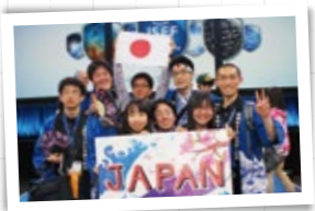
頑張ろう、チームジャパン! (ISEF)