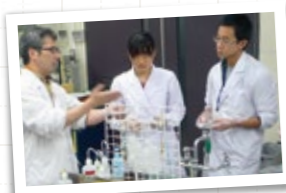
冬期特別セミナーで 実験演習に挑戦 (生物学オリンピック)