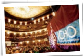
晴れがましい表彰式の舞台 (化学オリンピック)