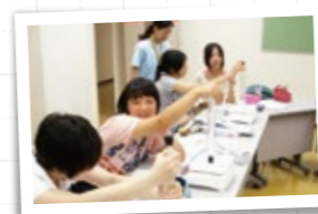
フレチャレンジは、物理チャレンジへの第一の扉です (物理オリンピック)