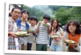
夏季セミナーではバーベキューを楽しむひと時も (数学オリンピック)