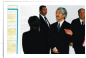
秋篠宮殿下のご内覧のようす (日本学生科学賞)