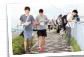
授業では珍しい地理のフィールドワーク (地理オリンピック)