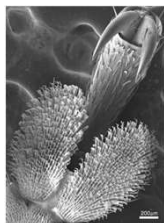
纳米套装（纳米聚合膜）