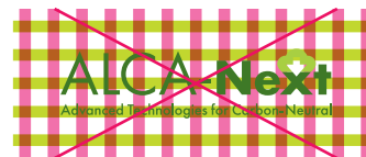
複雑な背景、強いパターンの上に配置 禁止