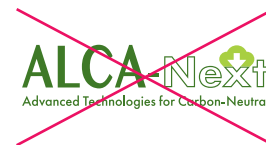
文字のアウトライン化やフォントの種類変更等、ロゴの 改変 禁止