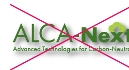
ロゴマークに影をつける 禁止