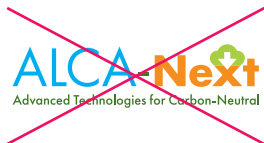
ロゴのカラー変更 禁止