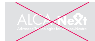
視認性の低い白抜き配置 禁止