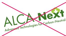
斜めの使用や反転させての使用 禁止