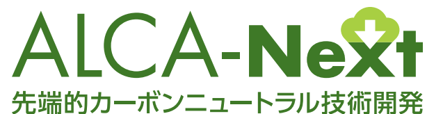
■v.04 ALCA-Next ロゴ+ 和文事業名 (縦組)