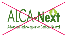
ロゴの縦横比率の変更 禁止