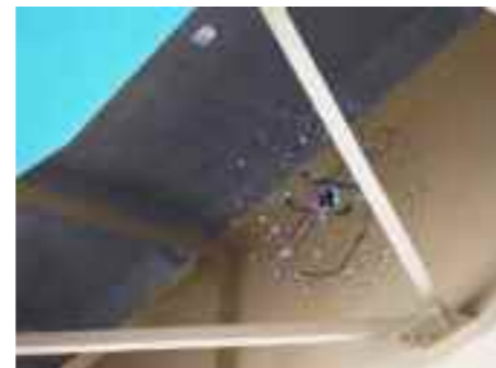
橋梁の桁間に入り点検するドローン(直径0.95m、重量2.5kg)