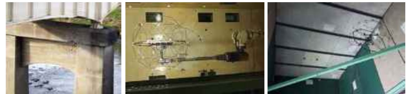
実橋梁での点検試行

『現場で使える/使いたくなる』ツールとしてのロボット技術を目指し点検・航空・建設の専門機関が主導する性能実証試験を定期実施