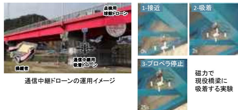
通信中継ドローンの運用イメージ