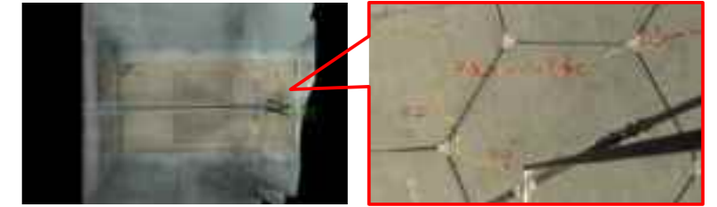
接写映像から復元した鋼橋床版の展開画像