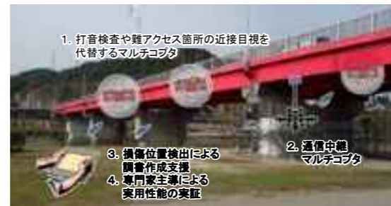
研究開発成果の最終イメージ