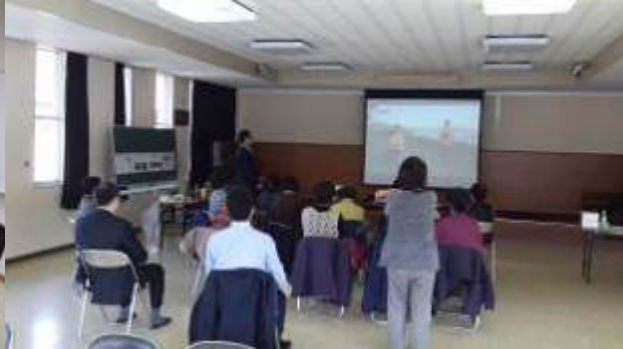
DVDを利用した体操の風景