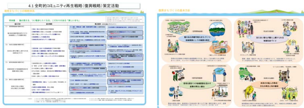
大槌町第2期復興実施計画