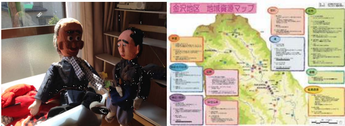
(助成例) 左：安渡娘（地元民話の人形劇）、右：金沢地区協議会（地域資源マップ）