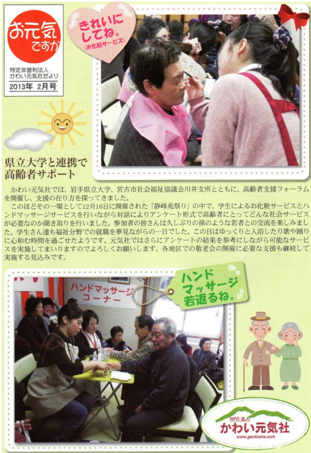
図4. NPO 法人かわい元気社の広報誌による取り組みの紹介