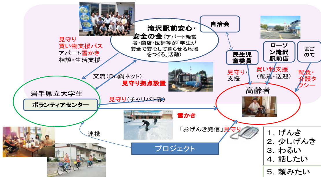
図2. 川前地区高齢者支援連絡会による生活支援、及び他支援との関連