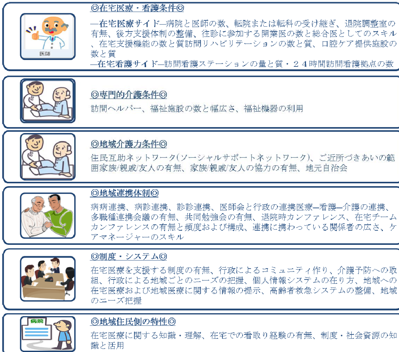
表1)社会資源の側面から考えられる在宅医療推進を左右するドメインごとのファクター

社会資源としての側面は、数値のような客観的な評価基準を用いやすく、介入も比較的容易であるのだが、その一方で、生活支援関係全般を取り巻く見えにくい側面、心理的・精神的・人的な要因も無視できない(表2)。