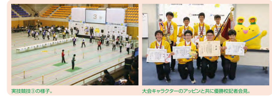
実技競技③の様子。 大会キャラクターのアップンと共に優勝校記者会見。

会場となった体育館の広さと高さを生かした実技競技③では、各校4人が参加し、ワイヤレス給電を行う「受電コイル」とモーターで動く「羽ばたき機」を製作し、機体をラインに吊ってレースを行