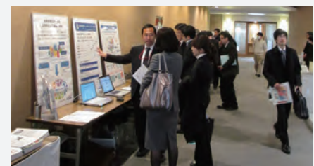
出展エリアでは来場者との活発な質疑応答が見られた。

今回の出展は、こうした活動をLOD関係者に広く知ってもらい機会となりました。コンファレンスには企業や大学の関係者200名以上が参加し、出展エリアでは利用可能なデータの詳細やLOD技術について活発な意見交