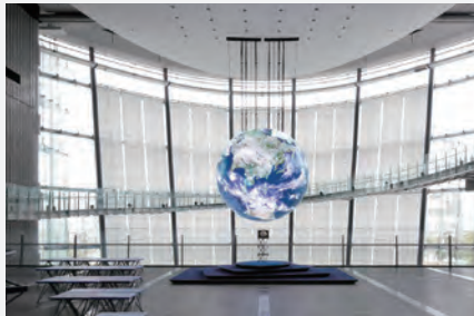
未来館のシンボル展示 Geo-Cosmos

1つは、未来館のシンボル展示である地球ディスプレイGeo-Cosmos（ジオ・コスモス）の新しい上映プログラム「軌跡～The Movements」。「人間の活動と地球観の変遷」をテーマに、約6億年前の大陸移動から現代の交通・移動まで人類が歩んできた“移動”の歴史を描き出します。1,000万画素を超える